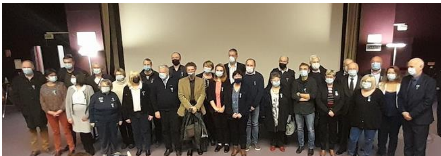
Vue d'ensemble des médaillés