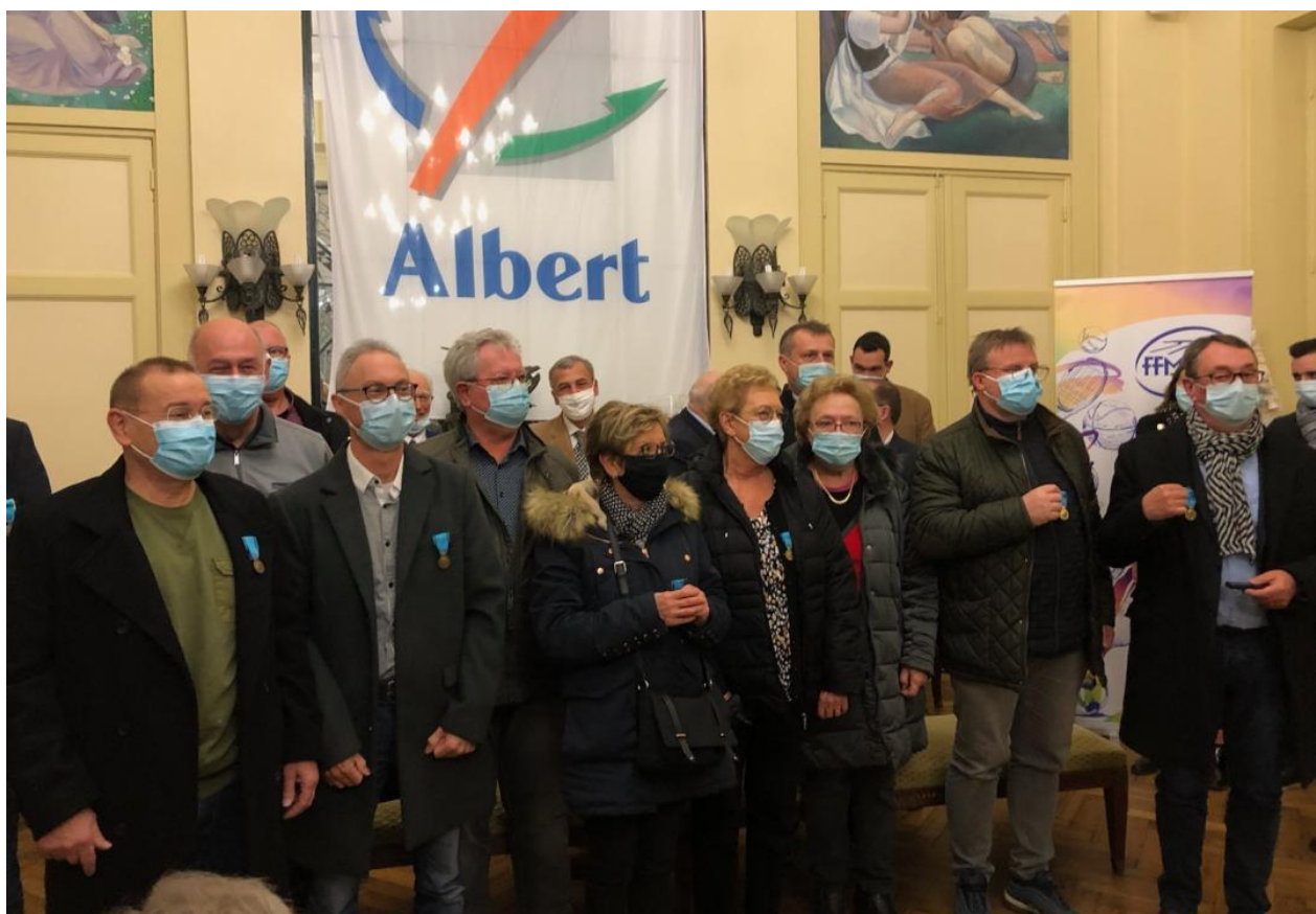
Le groupe des médaillés