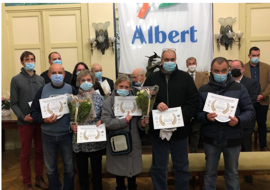
Le groupe des bénévoles