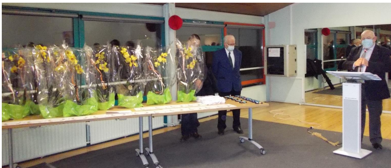
Ham, les fleurs offertes par le CD 80 de la FFMJSEA aux bénévoles féminines