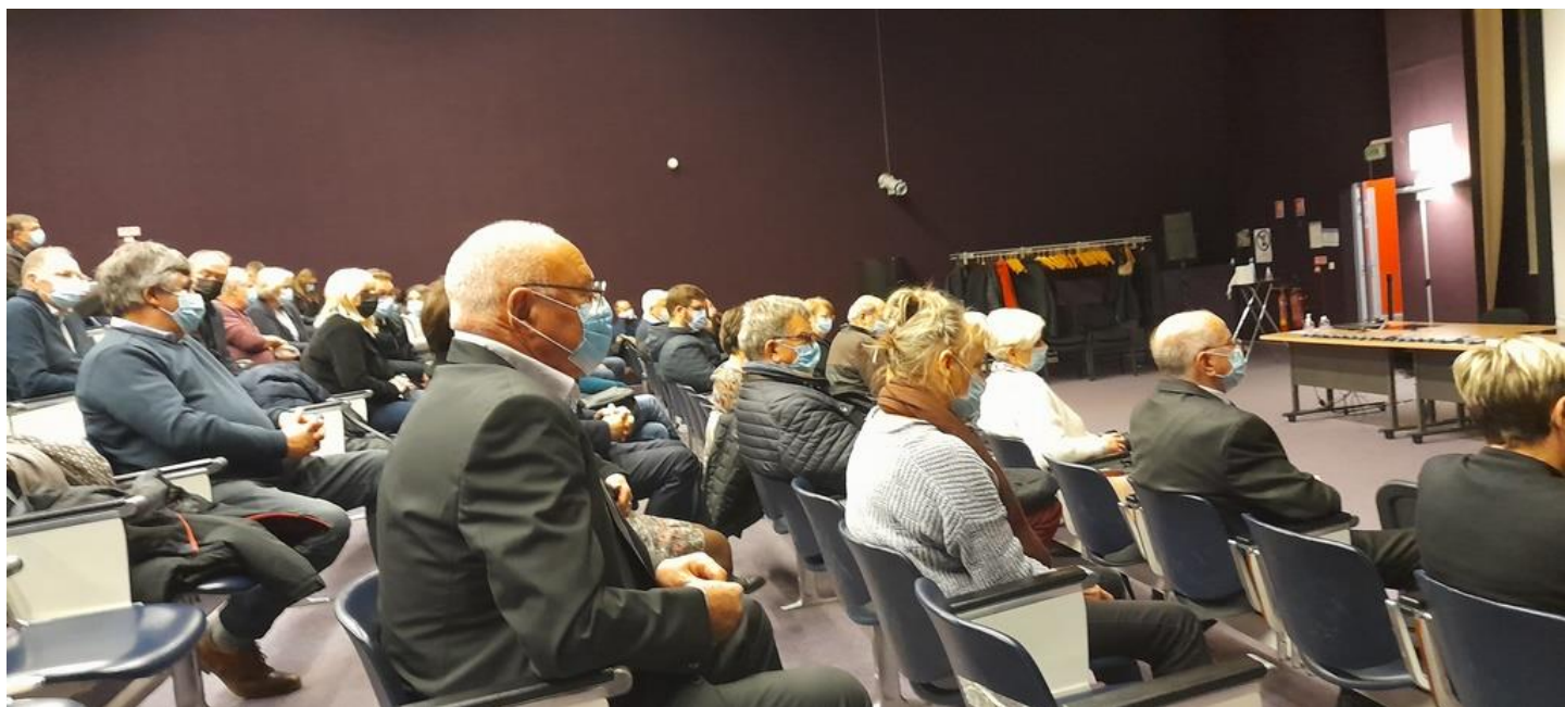
Vue de la salle où les distances et gestes barrière étaient respectés