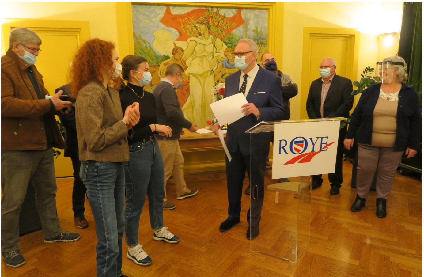
Remise des diplômes à 2 jeunes de moins de 20 ans