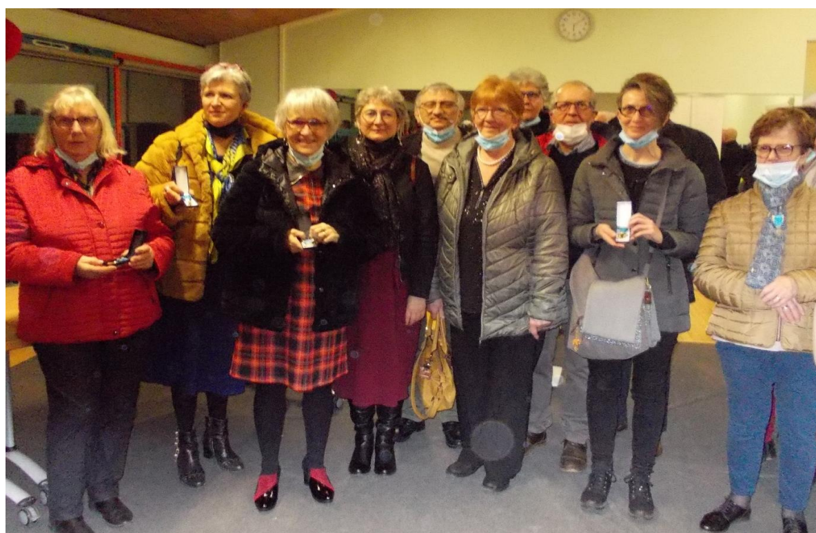
Le groupe des médaillés de Ham